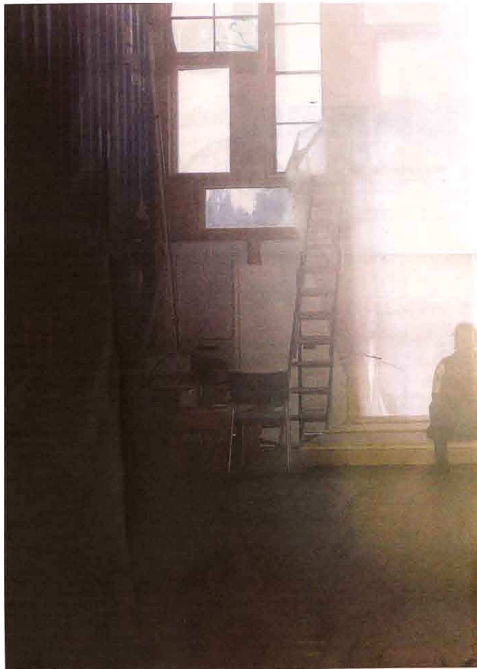
Inuti huset är det ännu bara ett stort rum, men när allt är klart ska här sjuda av olika aktiviteter.

Två dagar senare körde polisen ut dem. Efter ytterligare