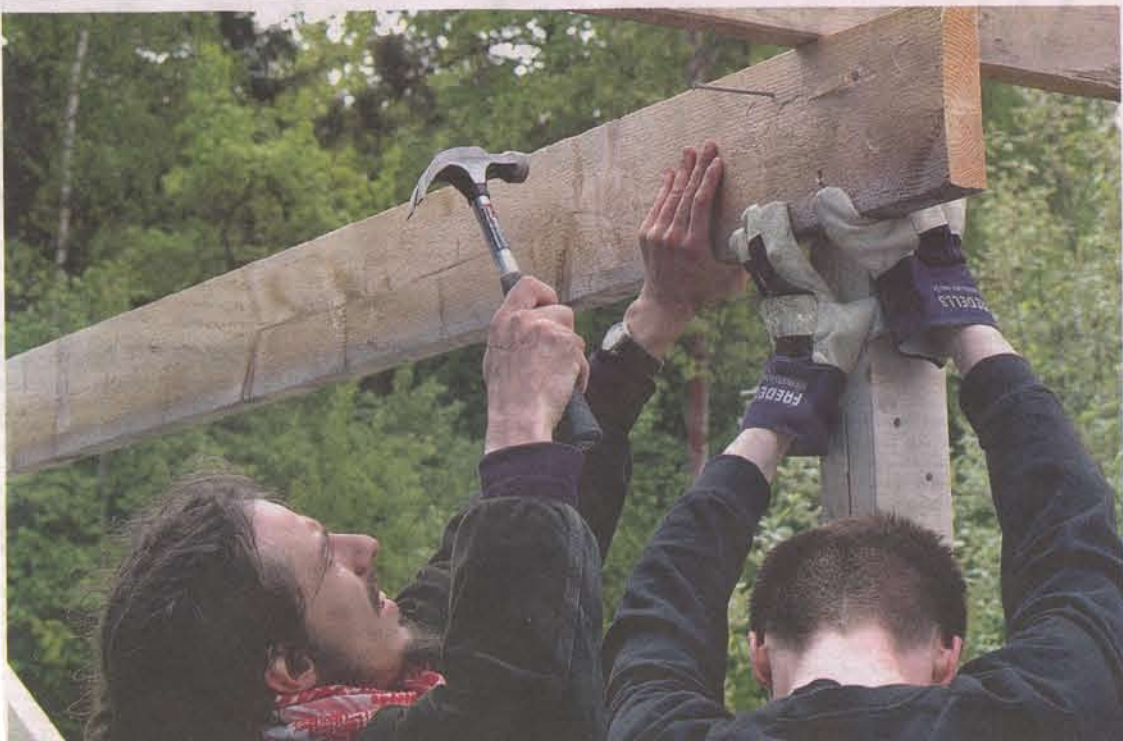
Efter tre års förberedelser är arbetet i gång. Kulturkampanjens medlemmar spikar ihop en byggnadsställning.